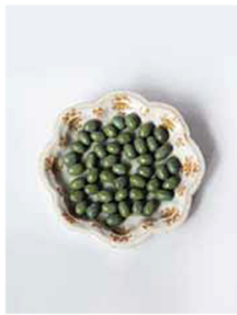
ci-contre Soucoupe en trompe-l'œil avec olives en faïence, Moustiers, ca 1760. Diam. 22,5 cm.