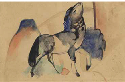
ci-contre Franz Marc (1880–1916), Tänzelndes Pferdchen , 1912, aquarelle et encre noire sur une carte postale manuscrite et signée, 9 x 14 cm.